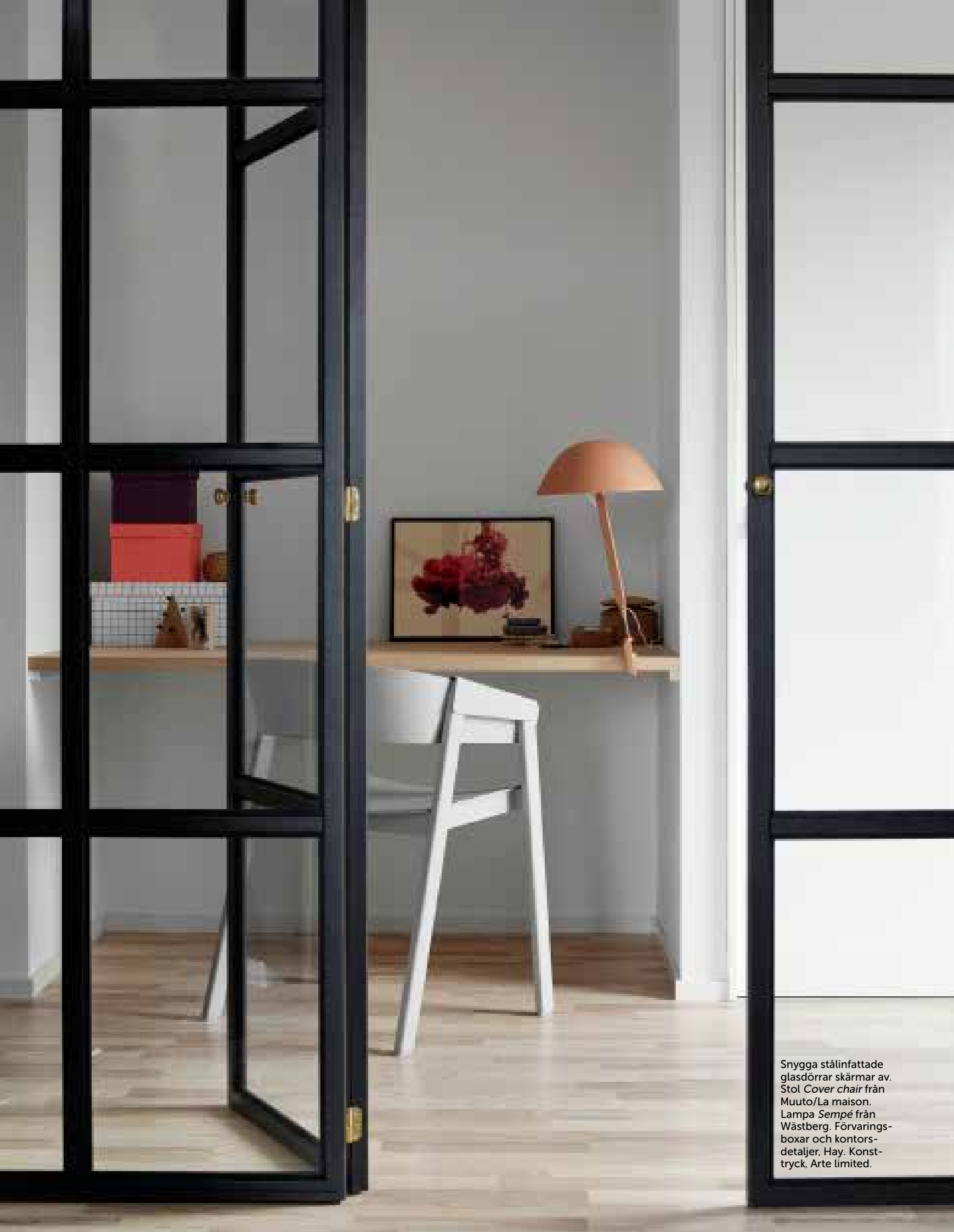
Snygga stålinfattade glasdörrar skärmar av. Stol Cover chair från Muuto/La maison. Lampa Sempé från Wästberg. Förvarings- boxar och kontors- detaljer, Hay. Konst- tryck, Arte limited.

› påslakan och stora grovstickade filtar. Det finns ingen teve, men gott om ljusstakar, sköna platser att slå sig ner på, som upplagt för samtal om ett framtida husköp. Men framförallt finns tid att röra sig i huset, känna in rummen: 150 kvadratmeter uppdelade på tre våningar, varje vård stylad av en namnkunnig stylist.