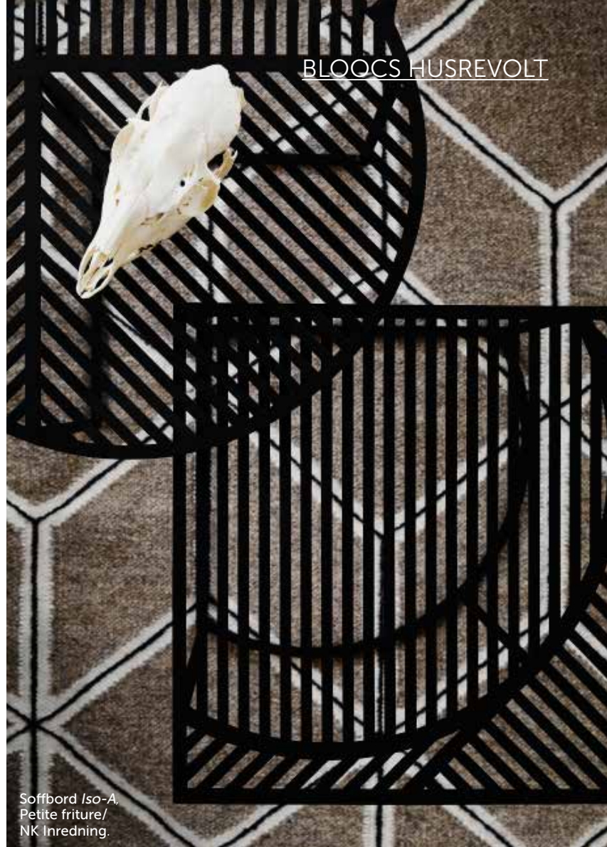
Soffbord Iso-A , Petite friture /NK Inredning.

»Varje bil har en bottenplatta, utifrån den byggs flera olika modeller. Vi har en grundmodell där kök och badrum är placerade på samma ställe, alla tekniska utrymmen är desamma, men sedan kan huset växa på höjden och bredden, som ett pussel där man lägger till fler bitar. Det är ett ekonomiskt sätt att bygga, 80 procent av all projektering kan vi ta med från ett projekt till ett annat. Vi har tänkt rationellt från början för att kunna lägga krut på detaljerna.« Arkitektkontoret Konzept har ritat husmodellen. De