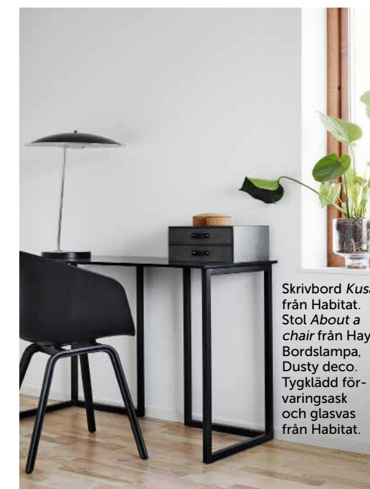
Skrivbord Kusa från Habitat. Stol About a chair från Hay. Bordslampa, Dusty deco . Tygklädd för- varingsask och glasvas från Habitat.

»VI HAR INGEN TJOCK TILLVALSKATALOG, DET PÅVERKAR SÅKLART SLUTPRISET.«