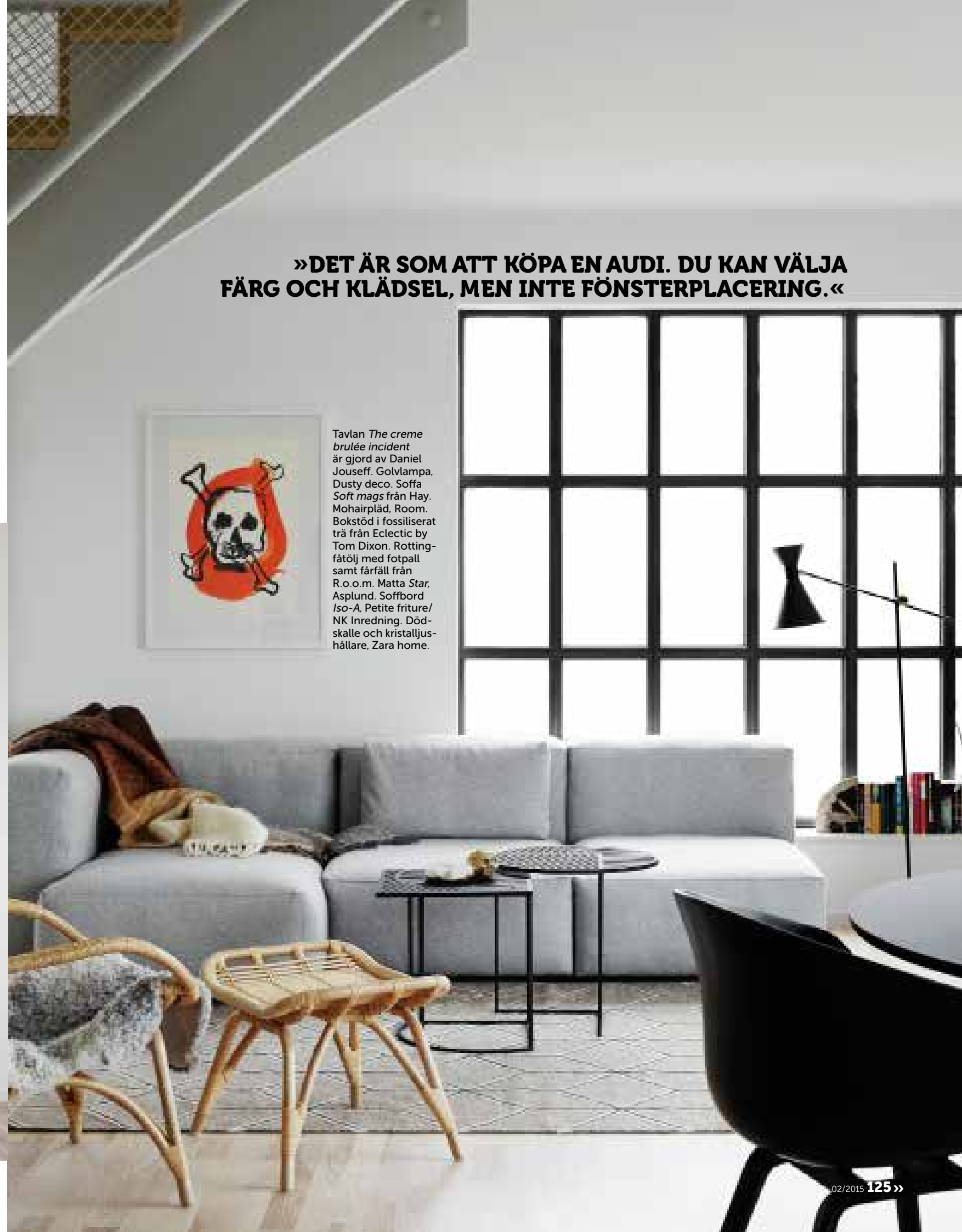
Tavlan The creme brûlée incident är gjord av Daniel Jouseff. Golv-lampa, Dusty deco. Soffa Soft mags från Hay. Mohairpläd, Room. Bokstöd i fossiliserat trä från Eclectic by Tom Dixon. Rotting-fätölj med fotball samt färffäll från R.o.o.m. Matta Star , Asplund. Soffbord Iso-A , Petite friture/NK Inredning. Dödskalle och kristallljushållare, Zara home.

»DET ÄR SOM ATT KÖPA EN AUDI. DU KAN VÄLJA FÄRG OCH KLÄDSEL, MEN INTE FÖNSTERPLACERING.«