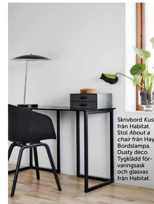
Skrivbord Kusa från Habitat. Stol About a chair från Hay. Bordslampa, Dusty deco . Tygklädd för- varingsask och glasvas från Habitat.

»VI HAR INGEN TJOCK TILLVALSKATALOG, DET PÅVERKAR SÅKLART SLUTPRISET.«