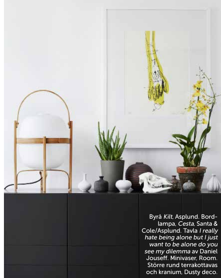
Byrå Kilt , Asplund. Bord-lampa, Cesta , Santa & Cole/Asplund. Tavla I really hate being alone but I just want to be alone do you see my dilemma av Daniel Jouseff. Minivaser, Room. Större rund terrakottavas och kranium, Dusty deco.

»Här kan jag tänka mig att bo«, fastslår sjuåringen. Det är en kylig vinterdag och vi har parkerat bilen utanför Bloocs visningshus Lone på Värmdö utanför Stockholm. Husen runt omkring har redan sålts, grannar spatserar omkring i området, samtalar gemytligt med varandra. En idyllisk bild av svenskt radhusboende. Vi flyttar smått förläget in våra saker i huset. Varsin övernattningsväska, några gosdjur. Det är en märklig känsla, som att flytta in hos en vän eller i en tillfälligt hyrd Air bnb-lya, minus de personliga pinalerna. För detta är ett testboende. I köket står en flaska vin och en matkasse från Köttbaren. Sjuåringen far upp och ner för de signalgula trapporna, bygger en koja i klädkammaren. I köksfönstret står färska kryddor, alla sängar är bäddade med lagom tillskrynklade