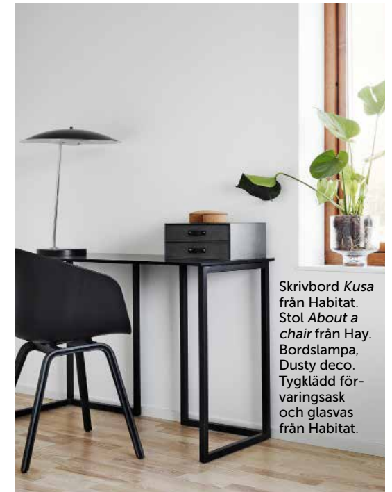
Skrivbord Kusa från Habitat. Stol About a chair från Hay. Bordslampa, Dusty deco . Tygklädd förvaringsask och glasvas från Habitat.

»VI HAR INGEN TJOCK TILLVALSKATALOG, DET PÅVERKAR SÅKLART SLUTPRISET.«