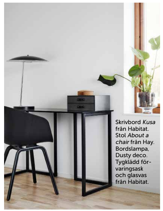
Skrivbord Kusa från Habitat. Stol About a chair från Hay. Bordslampa, Dusty deco . Tygklädd förvaringsask och glasvas från Habitat.

»VI HAR INGEN TJOCK TILLVALSKATALOG, DET PÅVERKAR SÅKLART SLUTPRISET.«