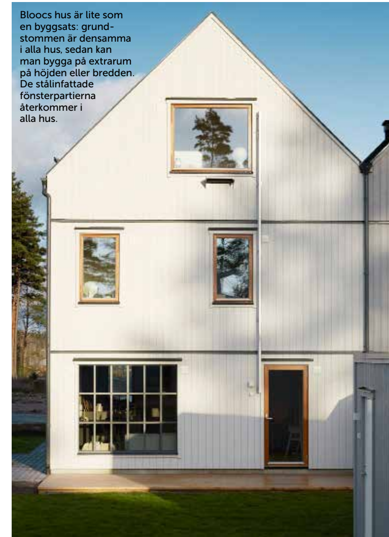
Bloocs hus är lite som en byggsats: grundstommen är densamma i alla hus, sedan kan man bygga på extrarum på höjden eller bredden. De stålinfattade fönsterpartierna återkommer i alla hus.